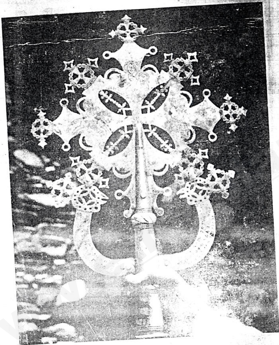
የግዢን የመገር መስቀል