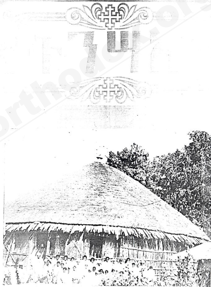
ጥንታዊ የግዢ ግርግር ቤተ ክርስቲያን