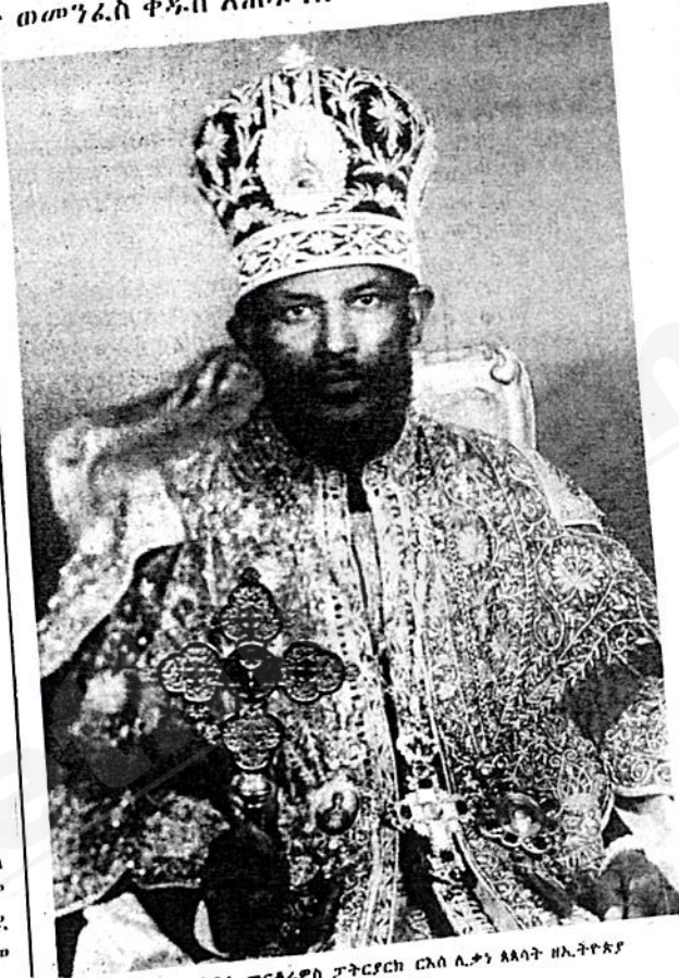
ብዕዕ ወትዳስ አቡነ ሙርቆሎስ ፓትርያርኩ ርኪስ ሊቃና ልሳት ዘኢትዮጵያ

በከተማና በገጠር በየብድና በባሕር ያላችሁ የኢትዮጵያን ዳርድንበር ለማስከበር ያገርን እንደ ነት የወገንን ደግነነት ለመጠበቅ በየጠረፉ የምትገኙ በሕመም ምክንያት በየሆስፒታሉ ያላችሁ እንደዚሁም በዚህ ሰዓት በልዩ ልዩ ቦታና ሥራ ላይ የምትገኙ ኢትዮጵያውያን ሁሉ የዘመናት ባለቤት እግዚአብሔር እንዲህ ከዘመን ግርቆስ ወደ ዘመነ ሉቃስ (ከህዘዥ ወደ ከህዘዥ ዓ.ም) በሰላም እሸጋገራችሁ። “ወእንትህክዱ ገቢረ ሠናዩ እስመ በዕድሜው ነእርሮ አምጣኝ ብኝ ዕለት ንግበር ሠናዩ ለነሱ።” በጎ ሥራ መሥራትን ቸል እንበል በጊዜው እናገኛለንና ጊዜ ላለን ለሁሉም መልካምን እንሥራ” (ገላ ፮፻፱ ፤) ዘመን ወይም ጊዜ ሲያልፍ በዓይን አይታይም ካለፈ በኋላ ግን መልካም ለሠሩበት በደስታ፣ ላል ሠሩበት በጸጸትና በኃዘን ይታወሳል። ያለፈንም ጊዜ ወደኋላ ተመልሶ ማንም ብልህ ወይም ጥበበኛ ሊያዘው የሚችል አይደለም። ነገር ግን ያለውንና የሚመጣውን ማለት ዛሬንና ነገን በጠዋት የሚነሱና ለመልካም ሥራ የሚተገቡ በሥራ ይይዙታል። እንደሚገባም ይጠቀሙበታል። በጠዋት የማይነቁና እስከ ቀትር የሚተኙ ግን መምጣቱንና መኖሩን ሳያውቁ ማለፉን ብቻ ይረዳሉ። ለፍጹም ነገር ትረፍልና።